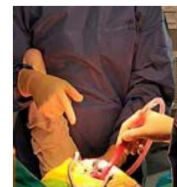
45 mn d'intervention pour réparer une hanche.

Le grand diamètre de la tête prothétique réduit de façon importante le taux de luxation. L'absence de pénétration du canal fémoral rend les implants de resurfaçage particulièrement indiqués en cas de déformation fémorale post-traumatique.